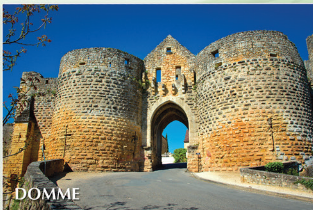
Bastide élevée sur une falaise : 7 kms