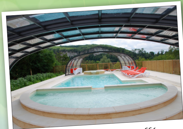
Piscine couverte et chauffée

SUR PLACE : Pain frais tous les matins (en juillet et août), une piscine avec pataugeoire et jacuzzi couverts et chauffés, un bar/snack avec un espace de rencontre, une épicerie avec produits du terroir, une bibliothèque en français, anglais et néerlandais, des jeux de société, des tables de ping-pong, un terrain de boules, deux aires de jeux pour les enfants, un terrain de volley, une connexion Wi-Fi sur l'ensemble du camping... Et aussi la baignade dans la Dordogne !