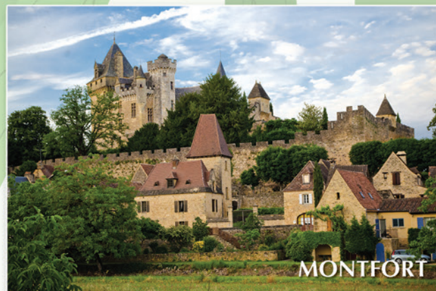
Le château de Montfort, à Vitrac, surplombe la Dordogne