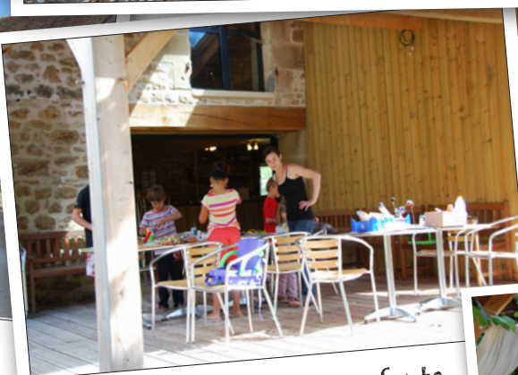
Animations pour enfants