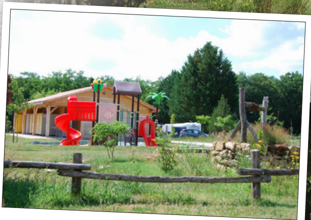
Aire de jeux pour enfants