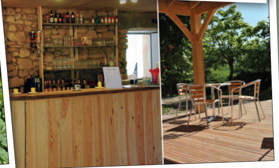
Bar / Shack