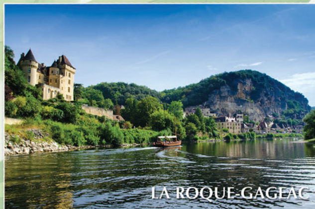
Un des plus beaux villages de France entre rivière et falaise : 7 kms