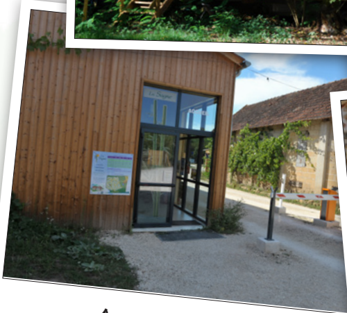
Accueil - Réception