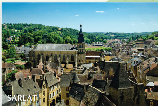
Classée au Patrimoine Mondial de l'Unesco en tant que Ville Historique : 8 kms